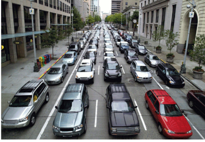
Voici 200 personnes dans 177 voitures