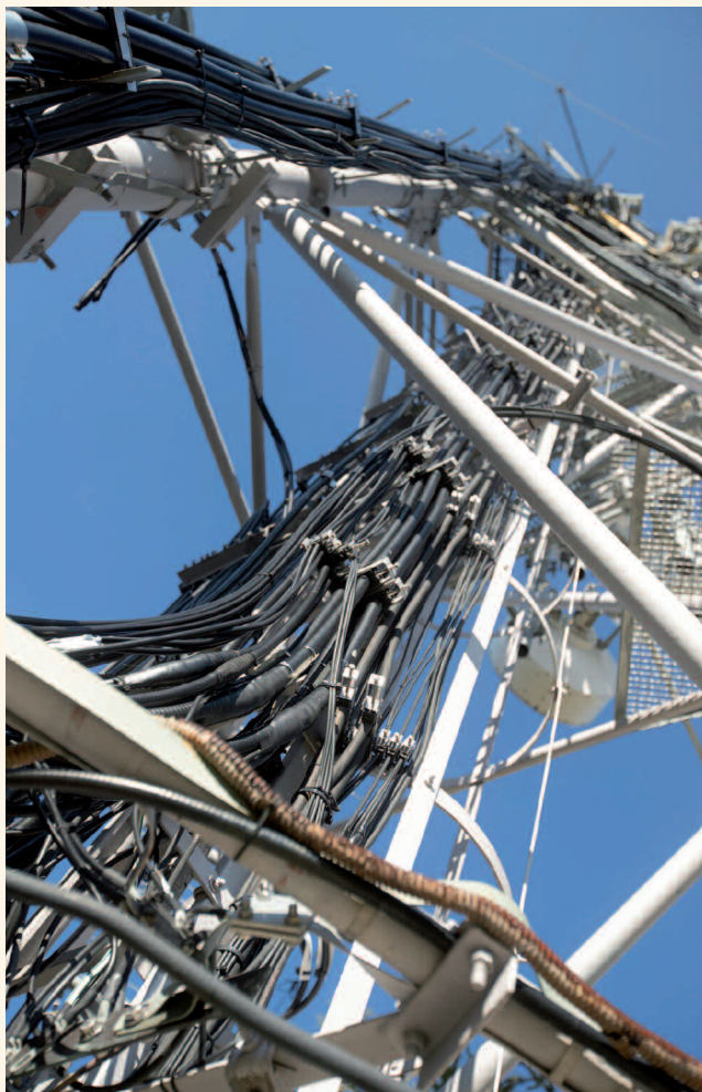
RELAIS DU COL DE SOLUDE - MASSIF DU ROCHAIL

LA CRISE DU COVID-19 ET LA GUERRE EN UKRAINE ONT RÉVÉLÉ AU GRAND PUBLIC LA TRÈS GRANDE DÉPENDANCE DE LA FRANCE EN MATIÈRE D'APPROVISIONNEMENT EN BIENS MATÉRIELS ET EN ÉNERGIE. LES INDUSTRIES DE MONTAGNE SONT, ELLES AUSSI, SOUMISES À CES RÉALITÉS. COMMENT INVERSER CETTE TENDANCE EN PRENANT EN COMPTE LES ENJEUX ENVIRONNEMENTAUX ? UNE ÉQUATION BEAUCOUP PLUS COMPLEXE QU'IL N'Y PARAÎT.